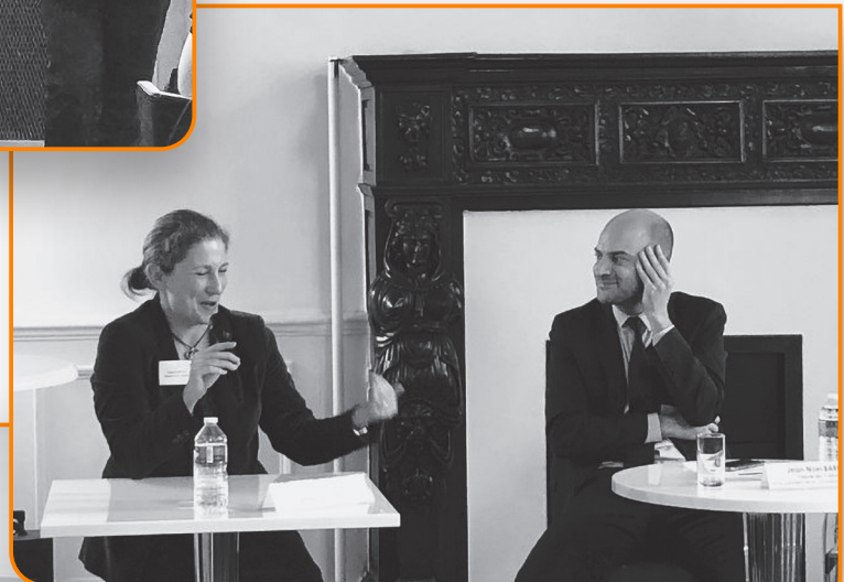
Débat entre Jean-Noël BARROT, Député des Yvelines, et Laure DARCOS, Sénatrice de l'Essonne : Comment les entreprises peuvent-elles mieux dialoguer avec les parlementaires au niveau national et dans les territoires ?