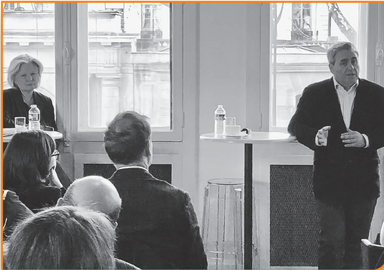
Ateliers Saint SIMON de SEANCE PUBLIQUE. Dialogue avec Xavier BERTRAND, Président de la Région Hauts-de-France. Focus sur des projets de territoires en Hauts-de-France